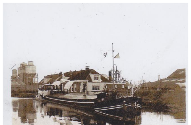
Op de achtergrond de Fabrieksweg